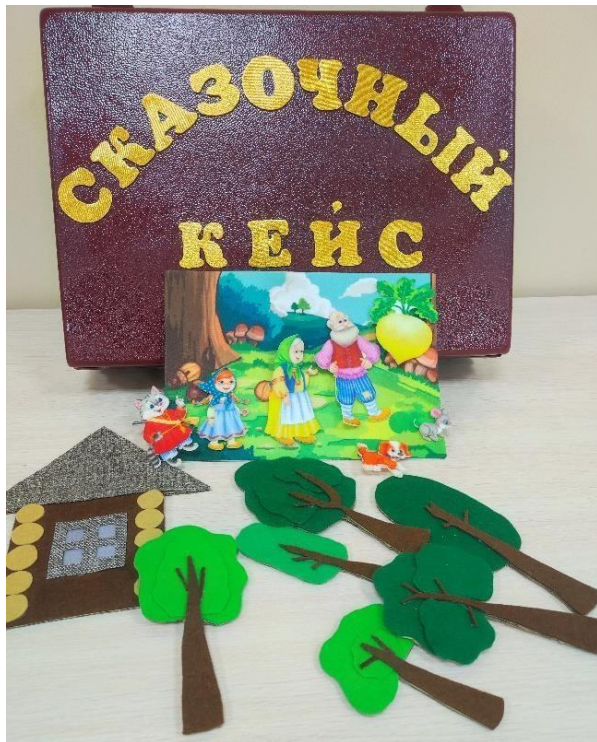
Сказка «Репка» (на липучках)