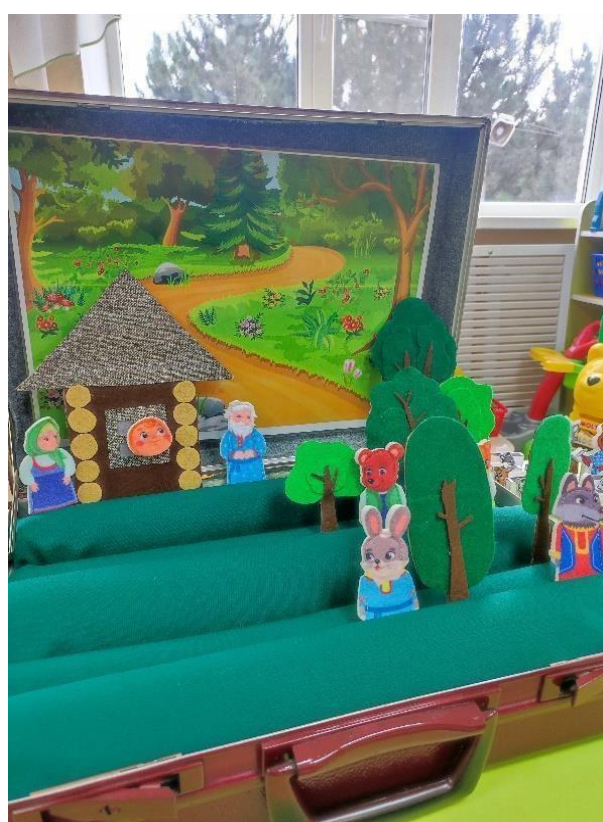
Сказка «Колобок» (пальчиковый театр)