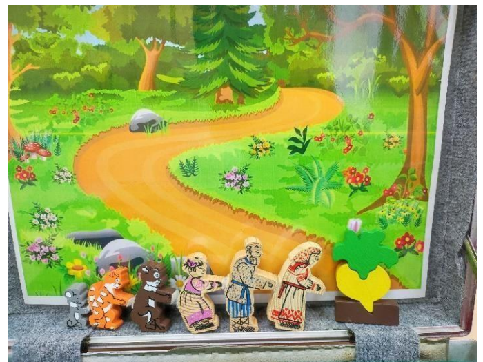
Сказка «Репка» (деревянный театр)