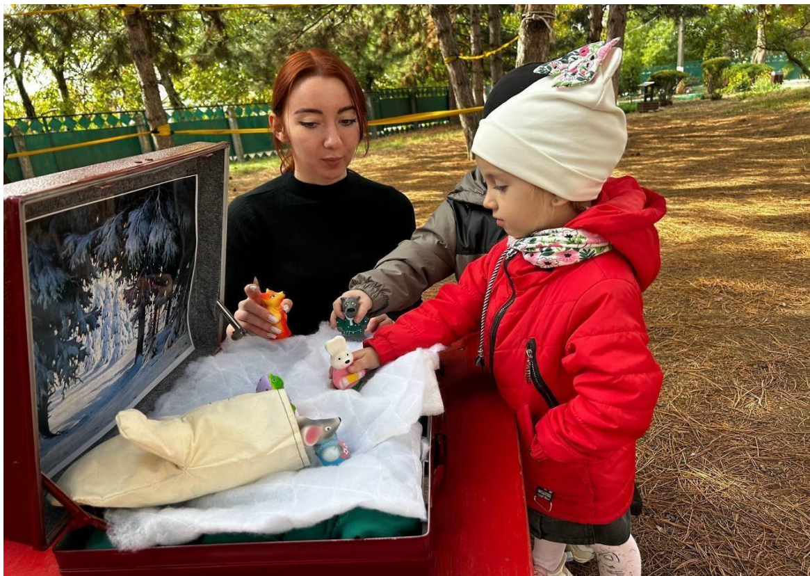
Обыгрывание сказки «Красная шапочка» с воспитанницей подготовительной группы.