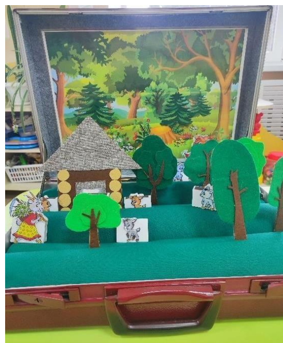
Сказка из спичечных коробков «Волк и семеро козлят»