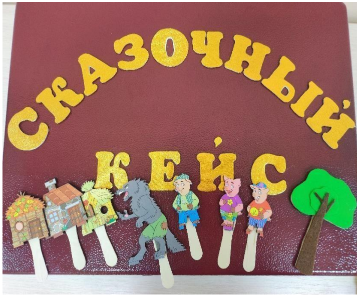
Сказка на палочках «Три поросёнка»