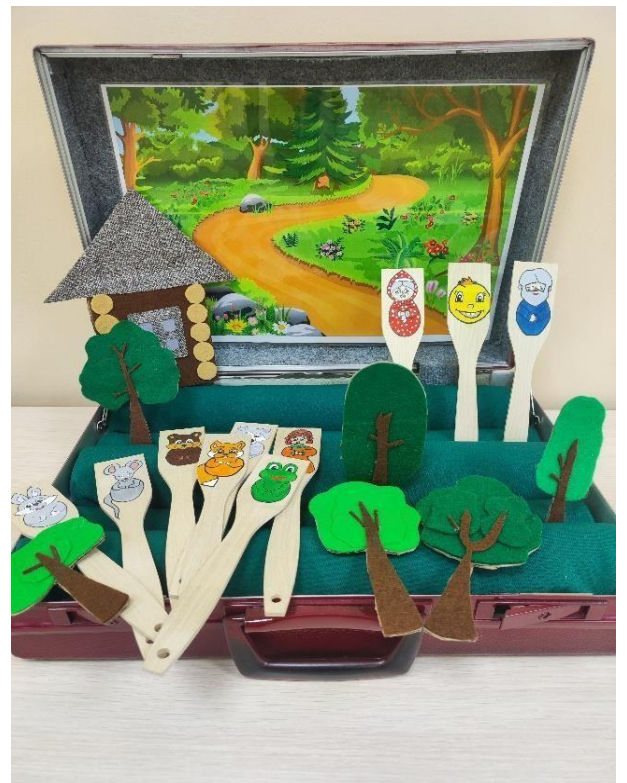
Сказка «Колобок» (на деревянных лопатках)