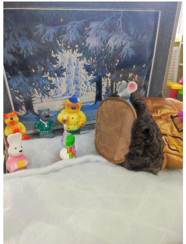
Сказка «Рукавичка» (резиновые персонажи)